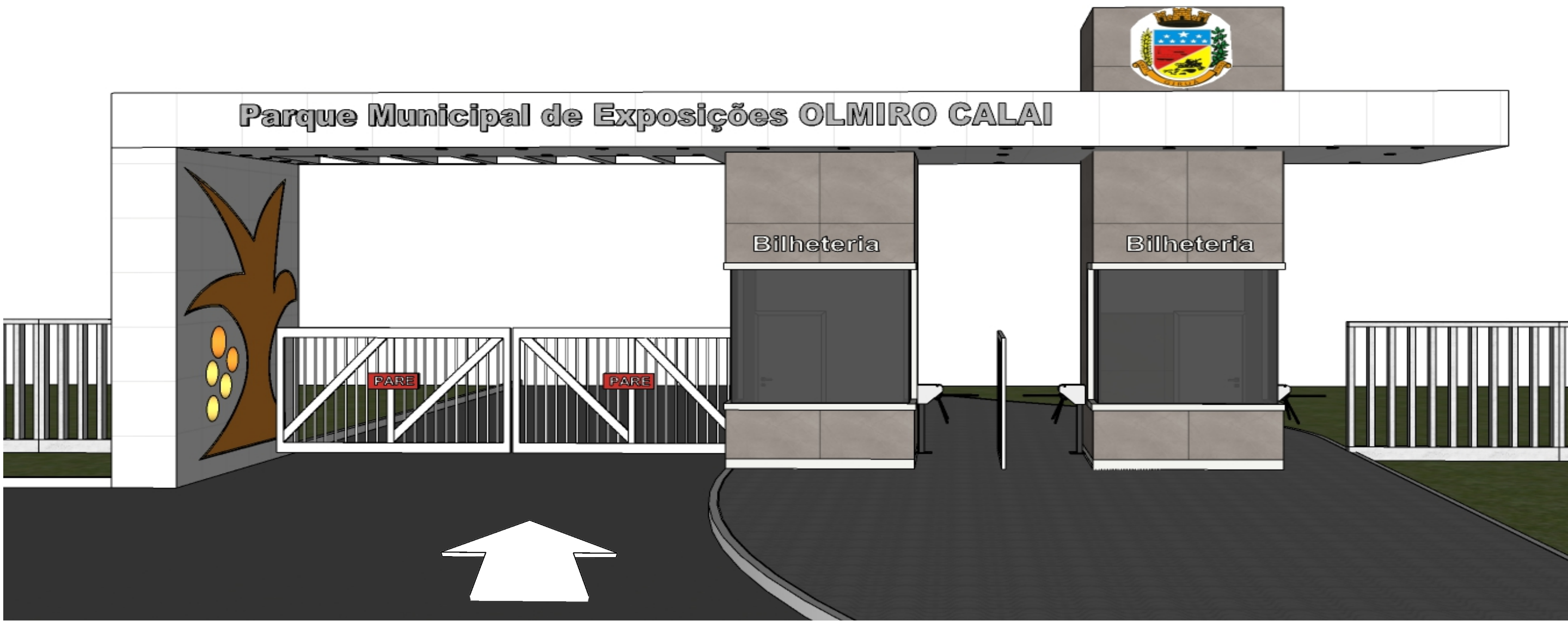
ACESSO AO PARQUE MUNICIPAL