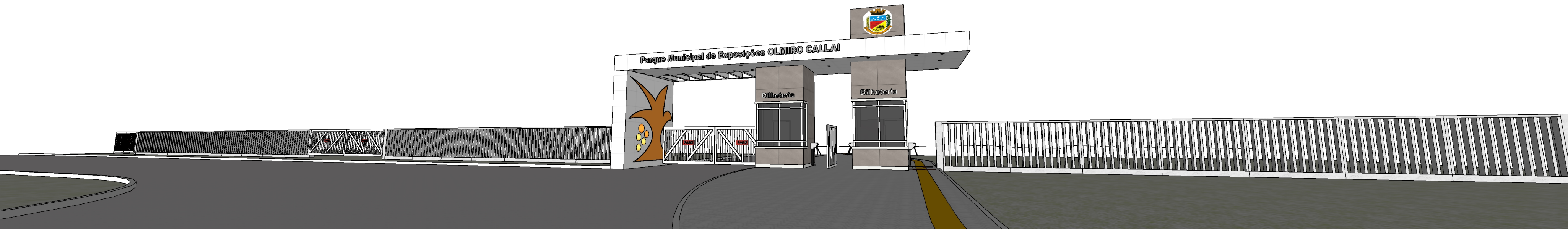
PERSPECTIVA Sem escala