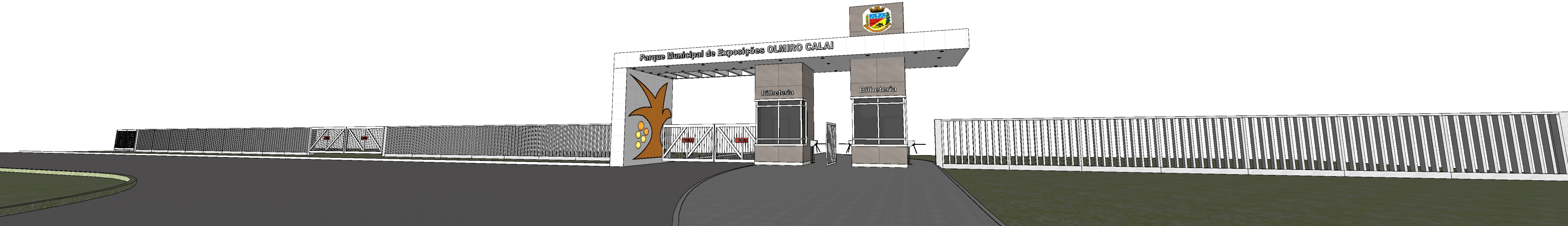
PERSPECTIVA Sem escala