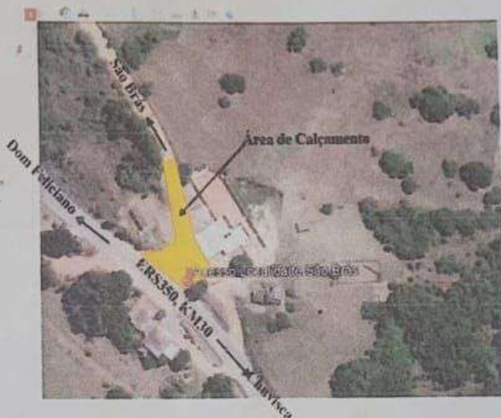
Imagem 01. Vista da localidade.

Altitude: 10m Altitude Imagem Satélite Altitude Imagem Aéreo