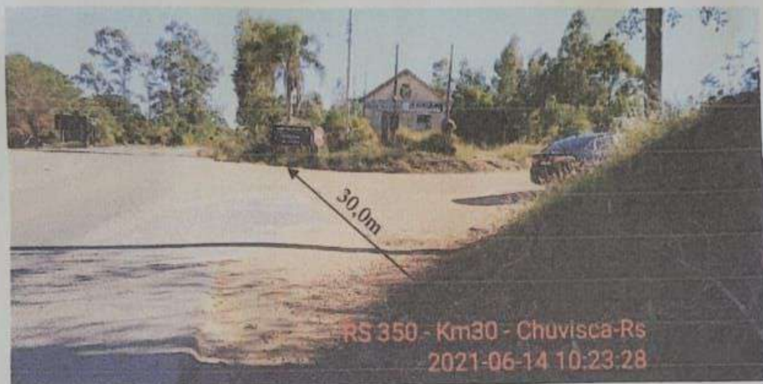
Imagem 04. Vista longitudinal, sentido Chuvisca/Dom Feliciano – margem direita.