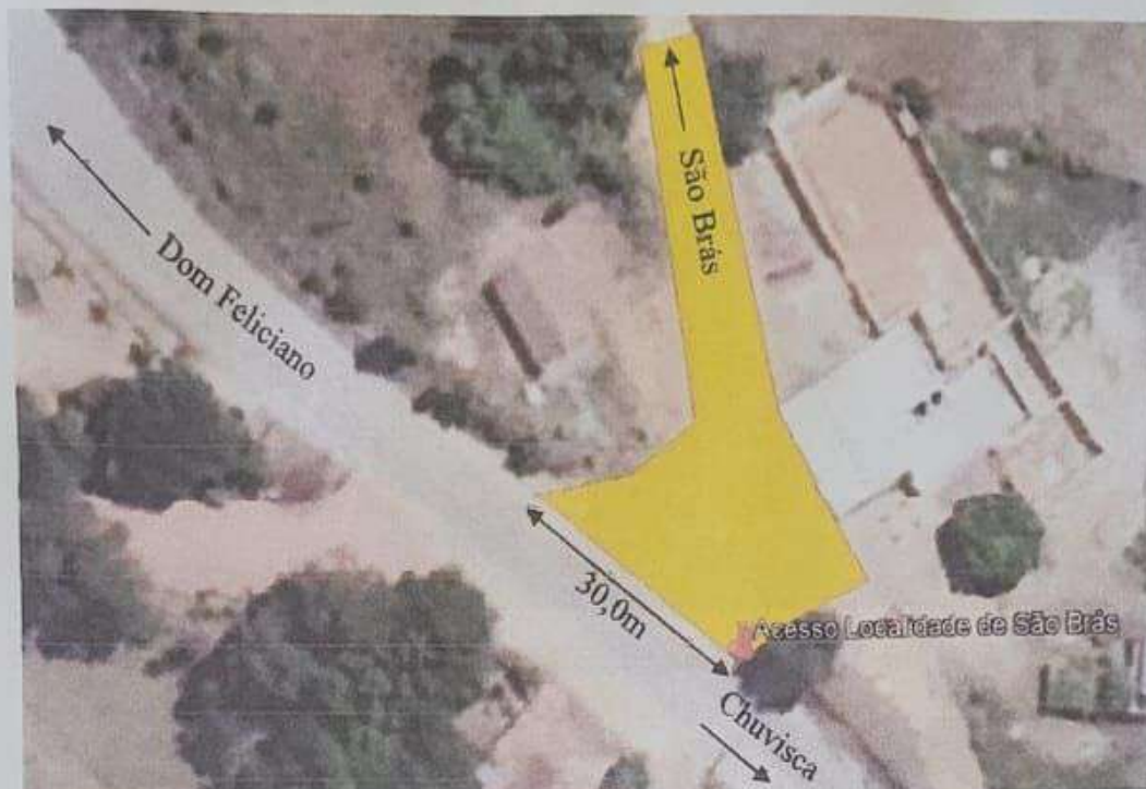
Imagem 02. Extensão de comunicação do acesso junto a ERS350.