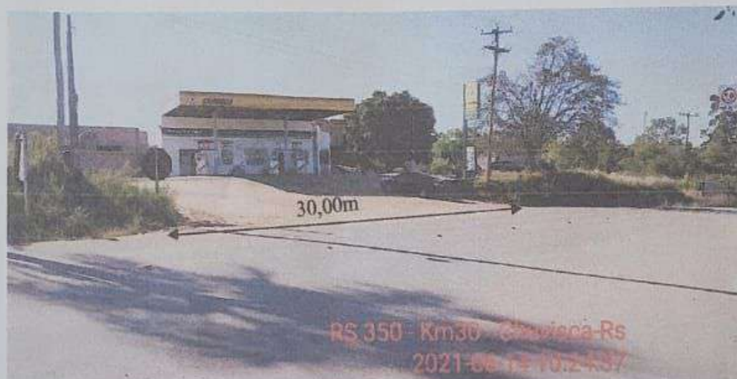
Imagem 03. Extensão de interesse de calçamento.

Avenida 28 de Dezembro, n.º 3000, Centro - Fone (51) 3611 - 7291 - Chuvisca/RS - CEP