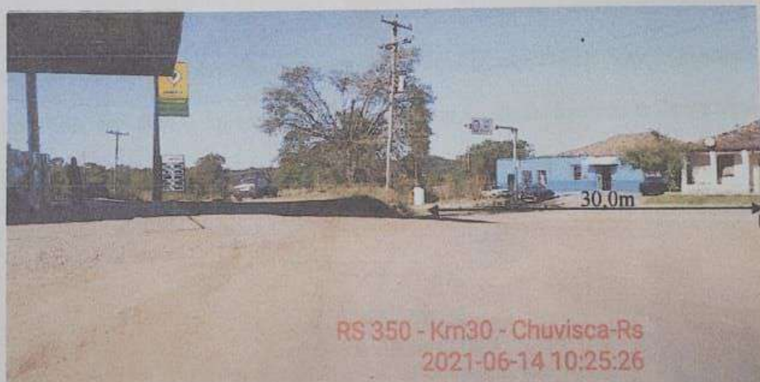
Imagem 05. Vista estrada municipal – acesso RS350 -KM 30 – Chuvisca -RS

Avenida 28 de Dezembro, n.º 3000, Centro – Fone (51) 3611 – 7291 – Chuvisca/RS – CEP