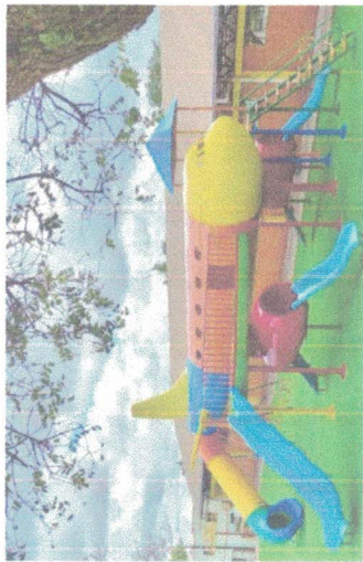
FACHADA DO PLAYGROUND ESCALA: 1/500