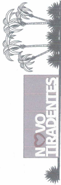
FACHADA DO LETREIRO ESCALA: 1/500