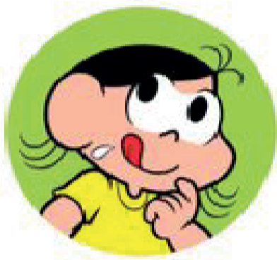
Gotinhas de saliva