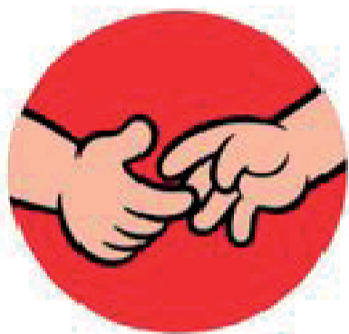
Aperto de mão