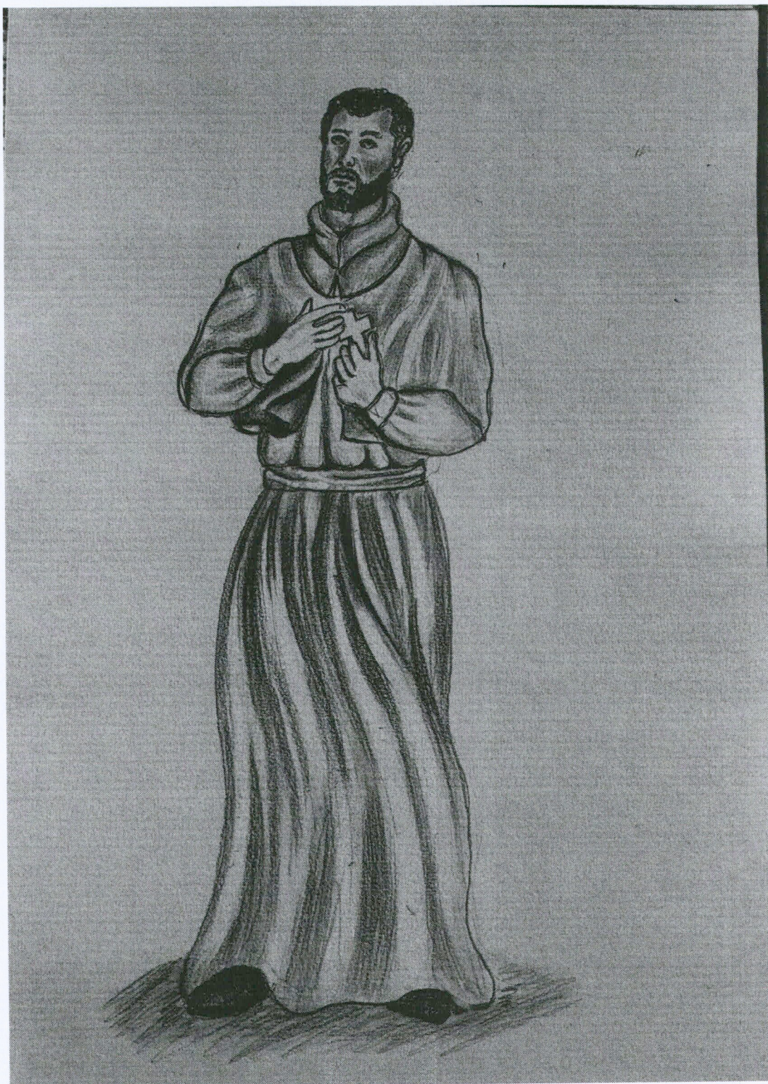
Desenho criação própria Adenildo Martins.