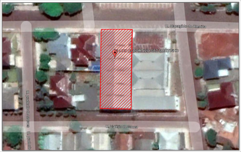
LOCALIZAÇÃO DA OBRA A PARTIR DO GOOGLE MAPS SEM ESCALA