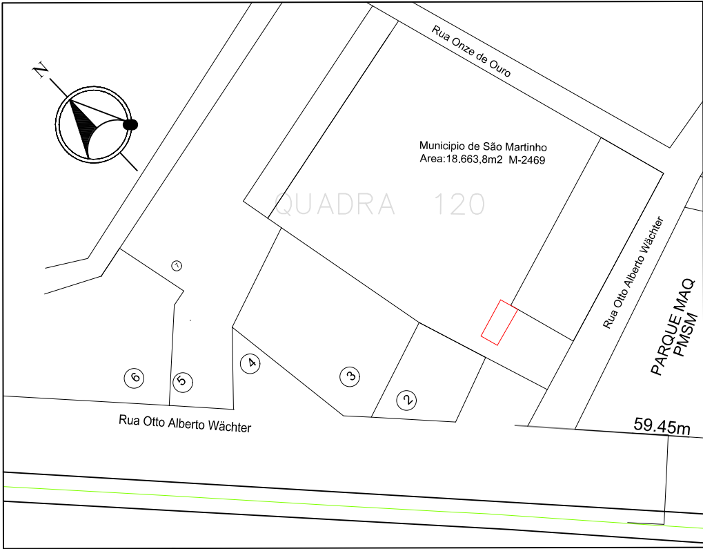
Situação / Localização