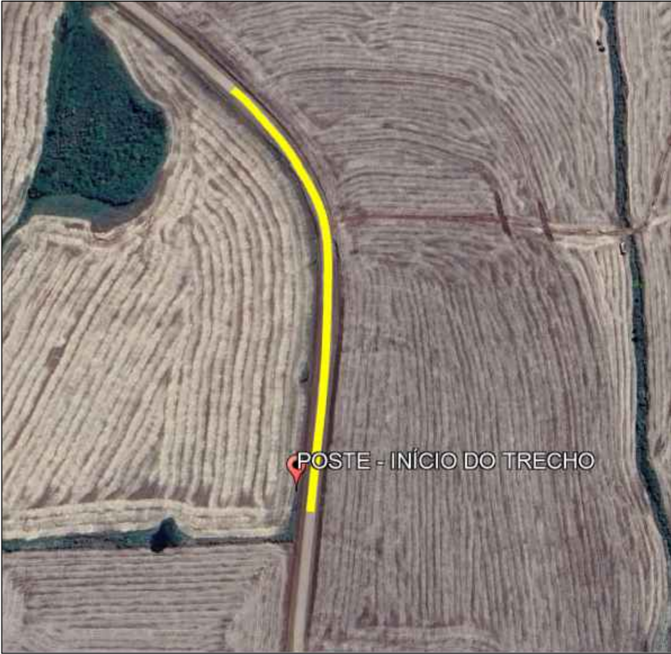
Imagem Satélite Localização

COORDENADAS - INICIAL 28°07'09.90" S 55°01'17.25" O