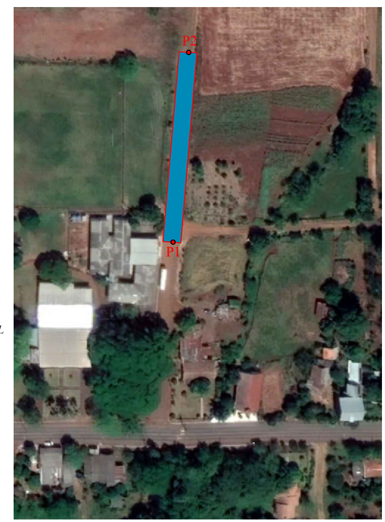
Imagem Satélite Localização Sem escala