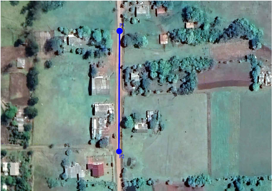
Imagem satélite - Localização