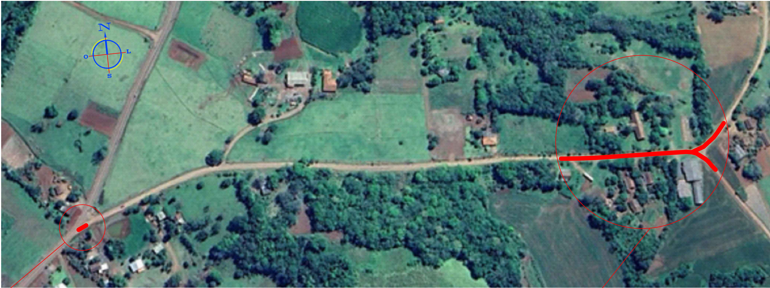
TRECHO 01 - ACESSO