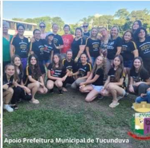
Apoio Prefeitura Municipal de Tucunduva