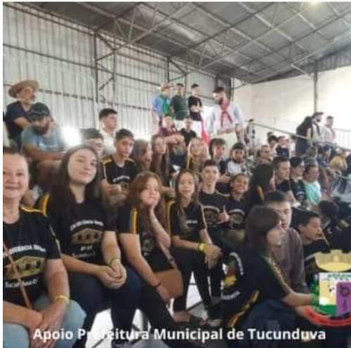
Apoio Prefeitura Municipal de Tucunduva

Com o apoio de Prefeitura de Tucunduva - 2021/2024 , no ano de 2023 o Ctg Querencia Xucra promoveu o festival da poesia, participou do ENART e do campeonato estadual de bolão.