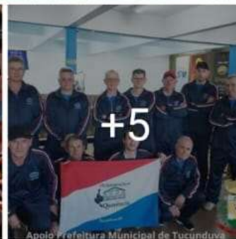
Apoio Prefeitura Municipal de Tucunduva