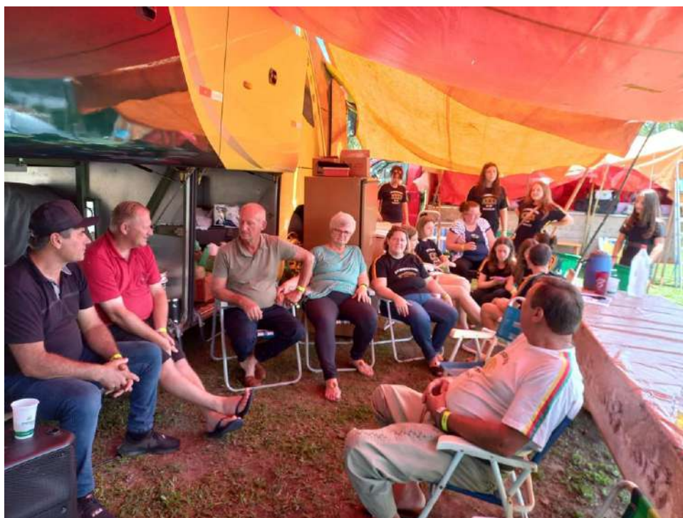
PARTICIPAÇÃO DO GRUPO DE BOLÃO NO CAMPEONATO ESTADUAL DE BOLÃO- EM CAXIAS DO SUL-RS