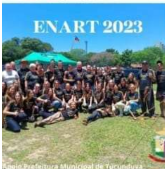
Apoio Prefeitura Municipal de Tucunduva