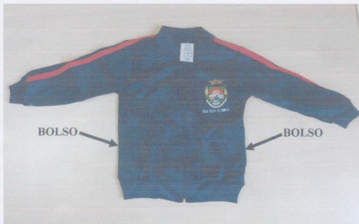
Anexo III – Casaco

Avenida Três Passos, 271 – Centro – CEP: 98.918-000 – Boa Vista do Buricá – RS Fone: (55) 3538-1155 - http://boavistadoburica.rs.gov.br